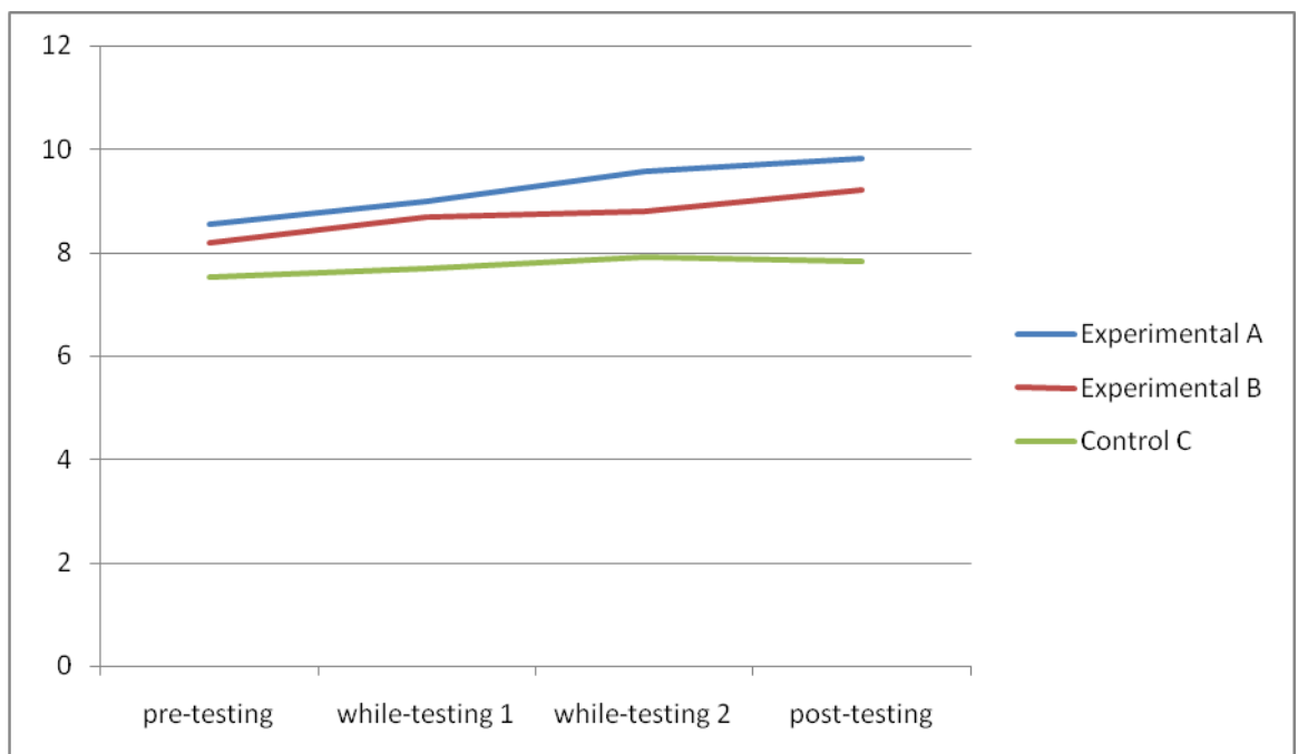
გრაფიკი 1. ექსპერიმენტის შედეგები: მოსწავლეების ენობრივი უნარ-ჩვევების დონე